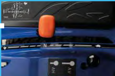
Mechanikus átváltó az első/hátsó hidraulikára