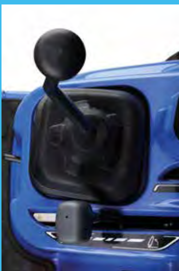
Joystick vezérlő „központ” a komplett hidraulikavezérléshez