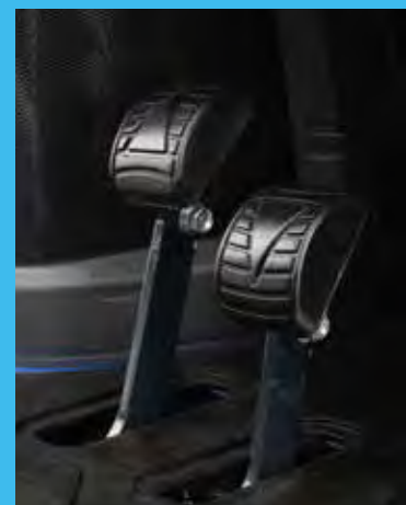
A hidrosztatikus hajtást vezérlő pedálok